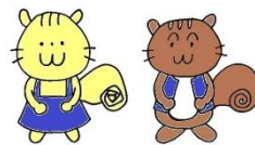
たまかわ校マスコット ありす&りすた

8月に入り、なお暑い日が続いています。子どもたちは、どんな夏休みを過ごしているのでしょうか？気になるところです。事故や病気、怪我なく、楽しく元気に夏休みを満喫してほしいと思います。第2学期の始業式に子どもたちに会えるのが楽しみです。