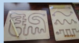
点むすび・なぞり