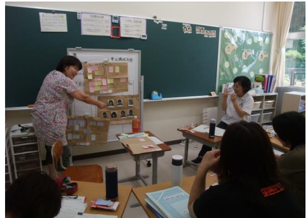
グループの児童の強み、課題は・・・・・・・・。