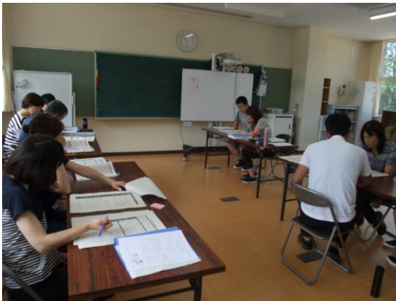
関連する教科を、チェック表をもとに整理。

限られた時間内ではありましたが、単元目標、単元を通して付けたい力、具体的な学習内容や時数、関連する教科等について、各グループがそれぞれ話し合いのもち方を工夫して意見を出し合いました。最後には、分校長先生から、研究の取り組みは学習指導要領がもとになっていること（学習指導要領のどの部分を押さえておく必要があるのか等）について指導助言がありました。